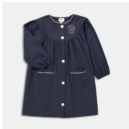
TABLIERS Notre-Dame de Pertuis-Tablier école fille brodé au logo, col rond - Marine dès 25,00 €