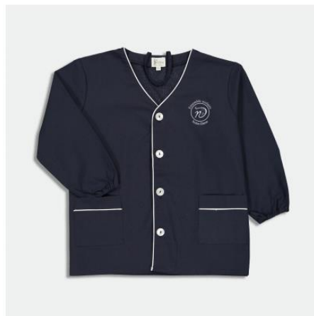
TABLIERS Notre-Dame de Pertuis-Tablier école garçon brodé au logo, col V - Marine dès 25,00 €

Rendez-vous sur notre site : www.letablierbobine.fr